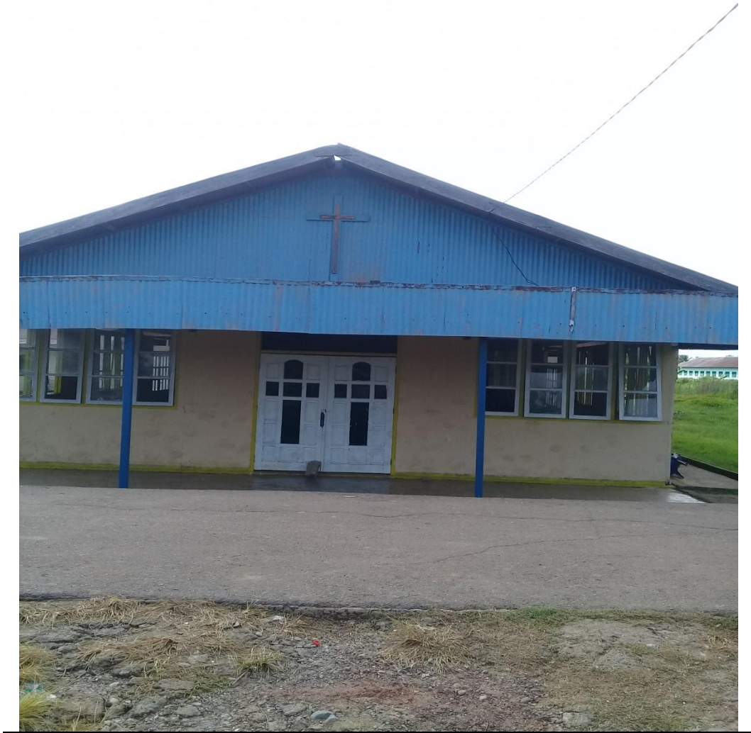
Gambar 1. Gereja Stasi Santo Yakobus SP7-Paroki Bunda Hati Kudus Kuper