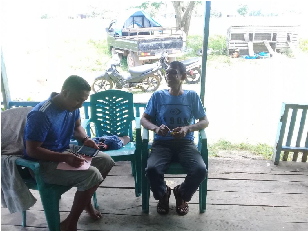
Gambar 3. Wawancara dengan Ketua Stasi