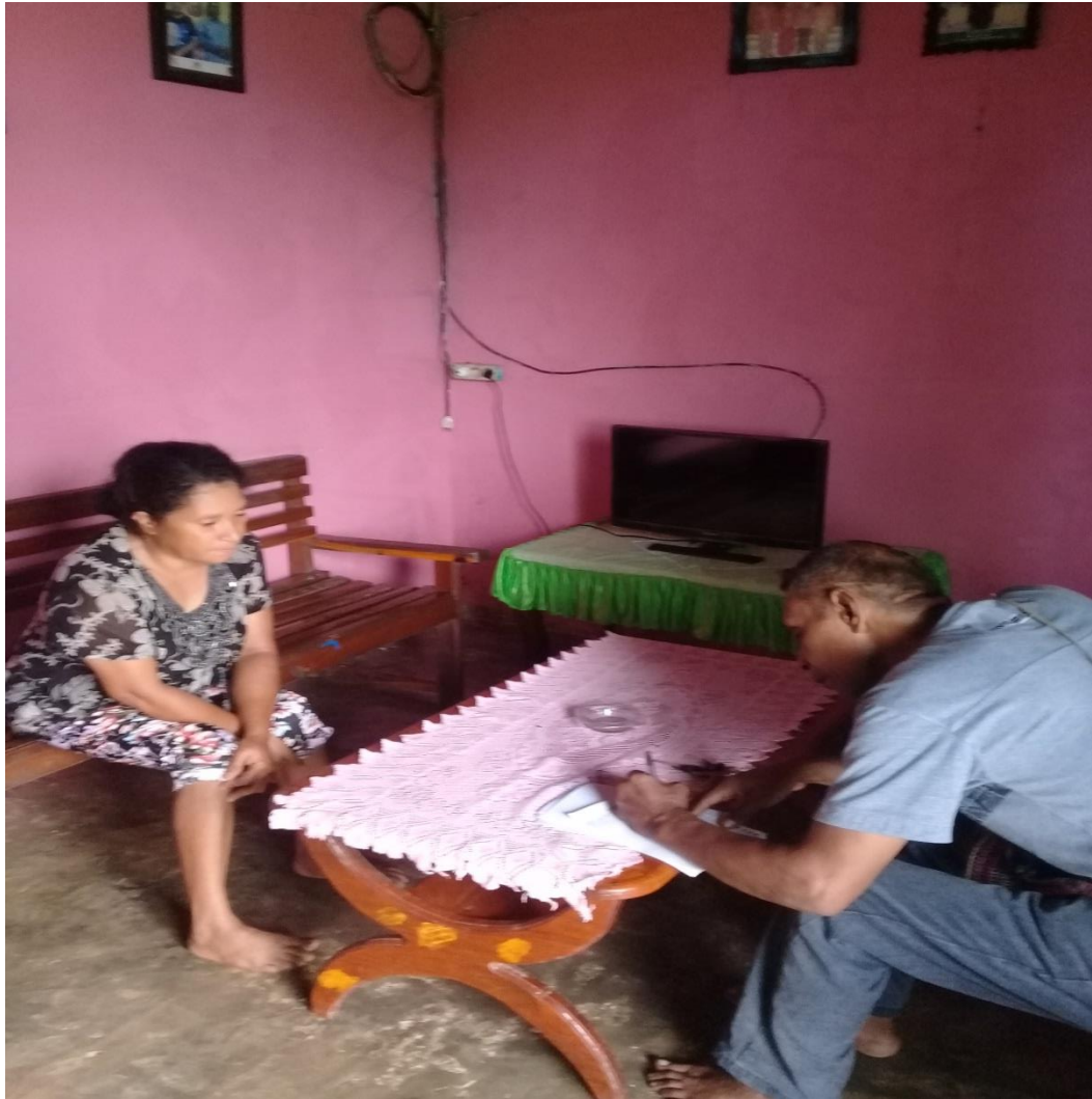
Gambar 2. Wawancara dengan umat di lingkungan Santa Bernadeta Stasi Santo Yakobus