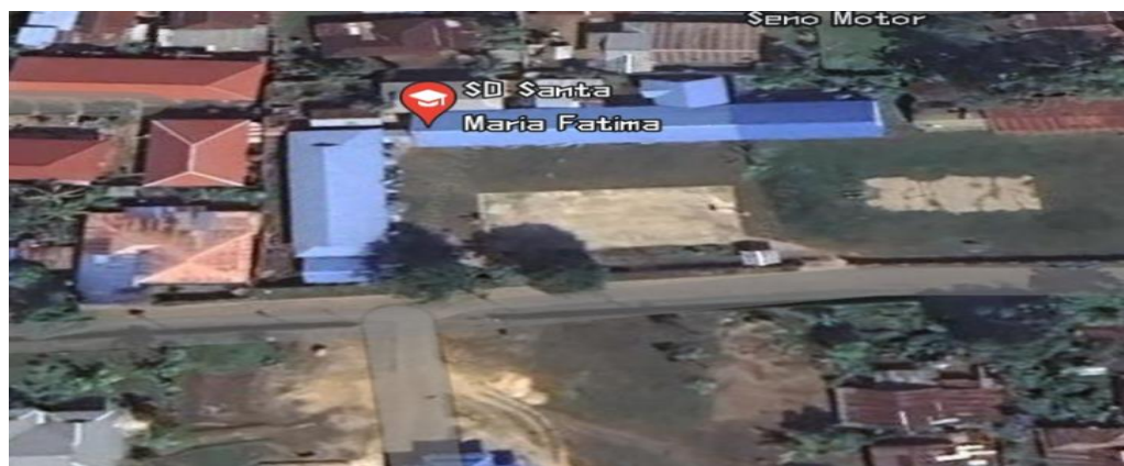
Gambar 3.1: Peta Lokasi Penelitian

Tempat penelitian ini adalah di Sekolah Dasar YPPK Santa. Maria Fatima Kelapa Lima Kelurahan Kelapa Lima Merauke. Penelitian ini dilakukan di Sekolah Dasar YPPK Santa. Maria Fatima Kelapa Lima, Kelurahan Kelapa Lima, Merauke. Pemilihan lokasi ini didasarkan pada hasil pengamatan peneliti yang menunjukkan bahwa sebagian besar peserta didik kerap melakukan tindakan kekerasan terhadap teman mereka sendiri. Kondisi ini mendorong peneliti untuk menelusuri faktor-faktor penyebab peserta didik melakukan tindakan kekerasan, baik secara verbal maupun non-verbal.