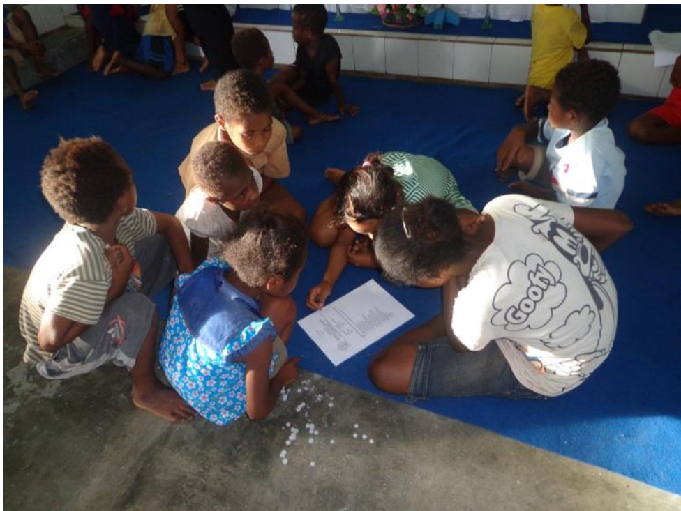
Proses katekese dengan metode penugasan