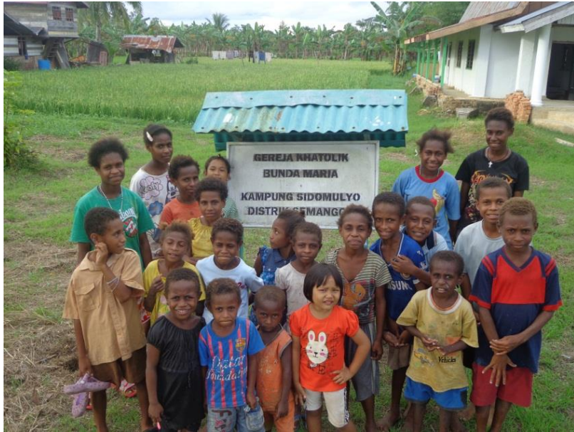
Foto bersama setelah kegiatan hari minggu