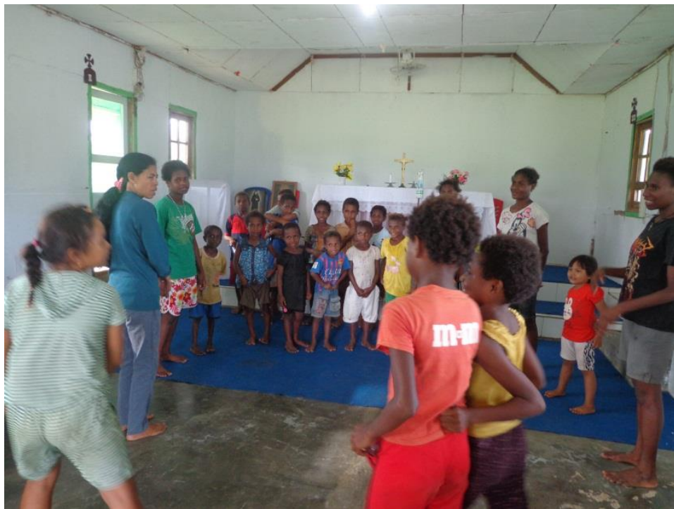
Katekese dengan metode bermain peran