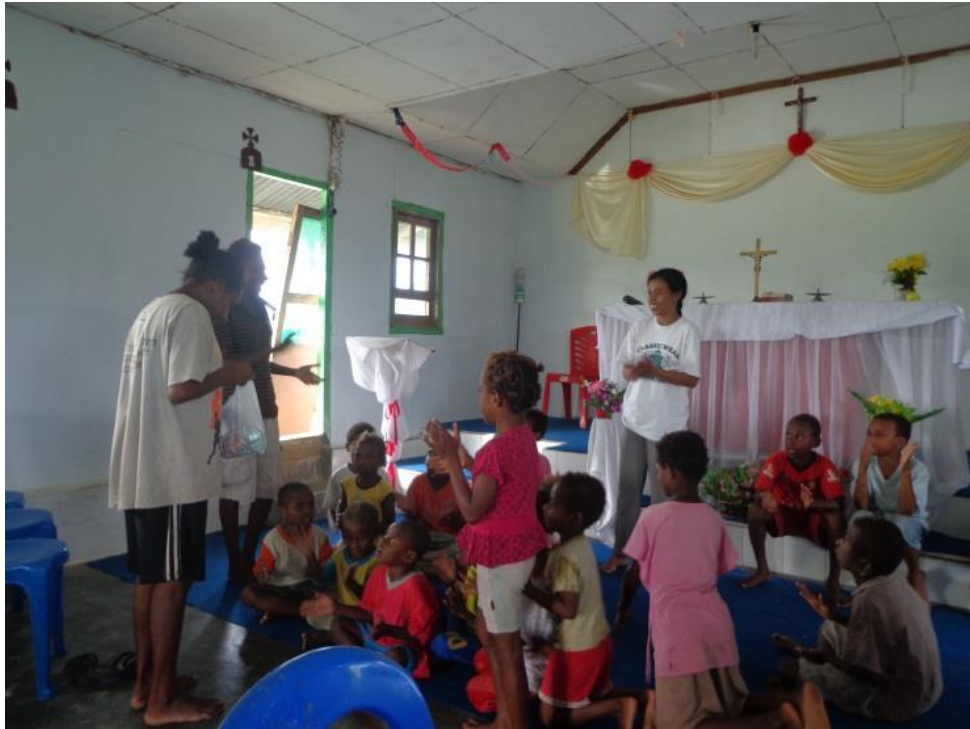
Pembinaan Minggu Gembira