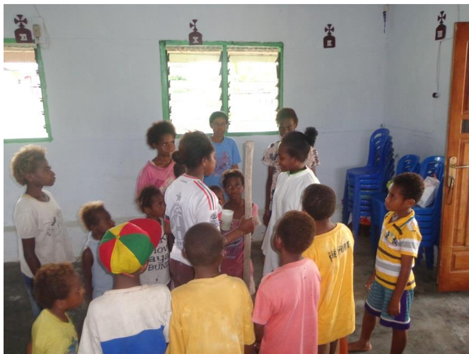
Proses katekese dengan metode bermain