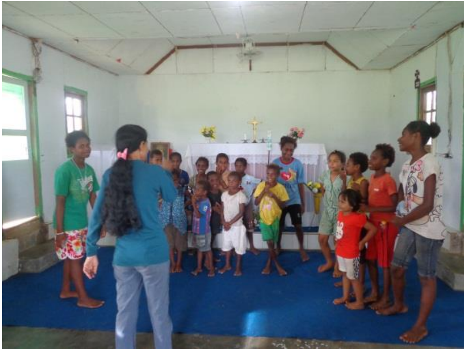
Proses katekese dengan metode ceramah bervariasi ceritera