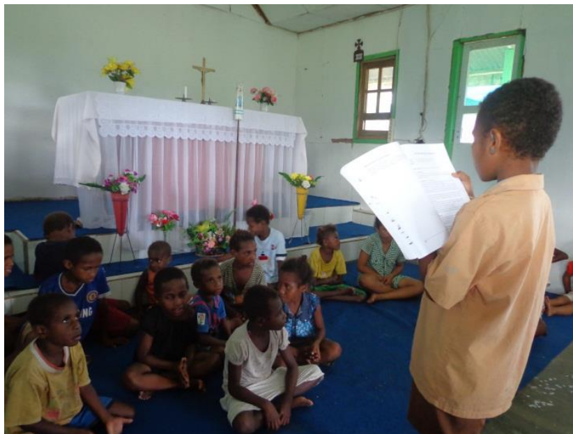
Salah satu peserta membaca ceritera