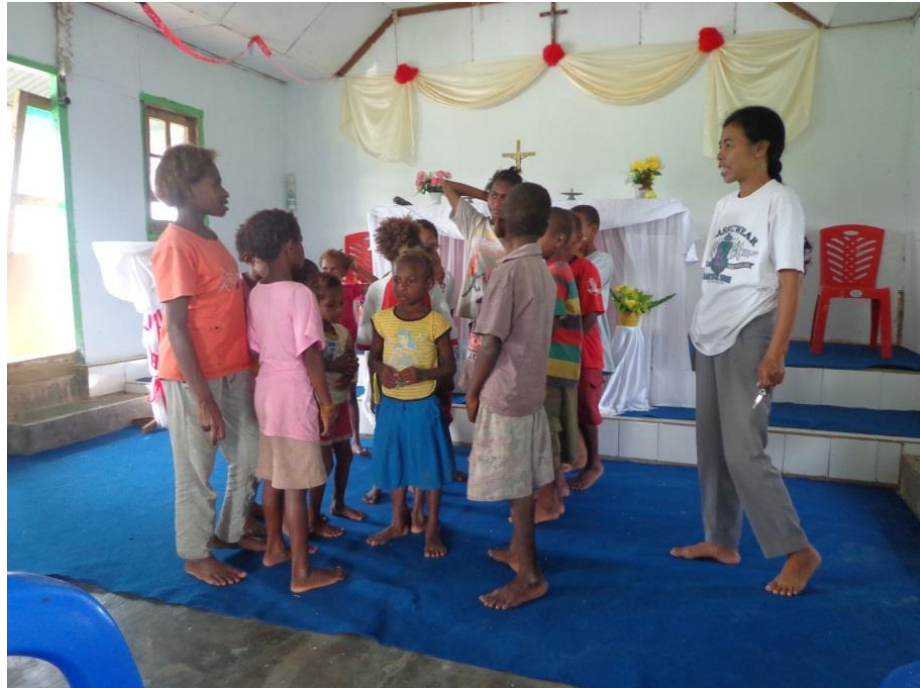
Proses katekese dengan metode bermain