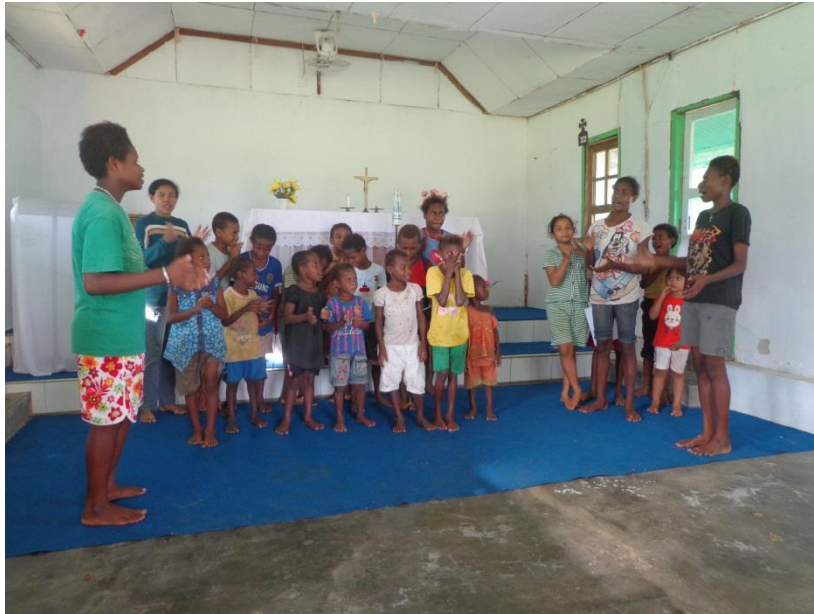
Kegiatan minggu gembira dengan siswa SMP dan SMK