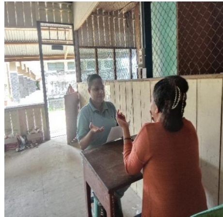
Gambar 8. Wawancara dengan T.R 28 juli 2025, 11.42. Di kantin.