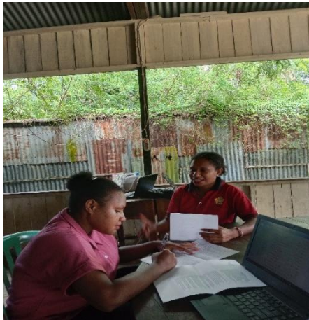
Gambar 7. Wawancara dengan F.Y.K 02 agustus 2025, 08.37. Di kantin.