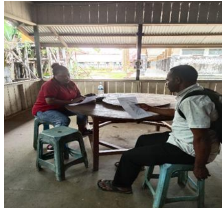
Gambar 6. Wawancara dengan GUS 29 juli 2025, 09.40. Di kantin.