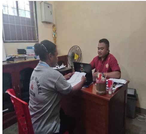
gambar 12. Wawancara dengan K.B.B 15 agustus 2025, 08.24. Rungan dosen.