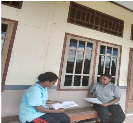
Gambar 5. Wawancara dengan D.K 24 juli 2025, 11.12. Di depan kelas cyirillus.