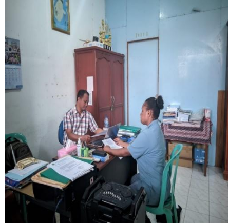
Gambar 10. Wawancara dengan Y.Y.S 28 Juli 2025, 10.59. Ruang Sarpras.