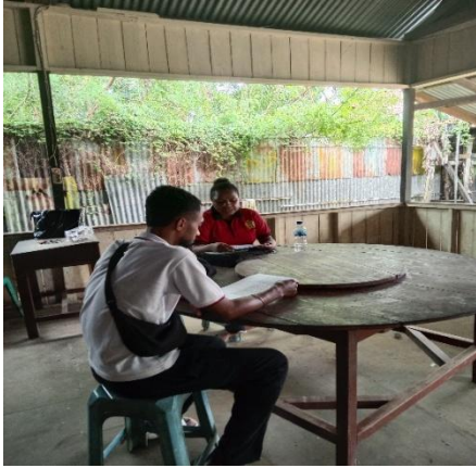
Gambar 9. Wawancara dengan B.M.D 29 juli 2025, 09.17. Di kantin.