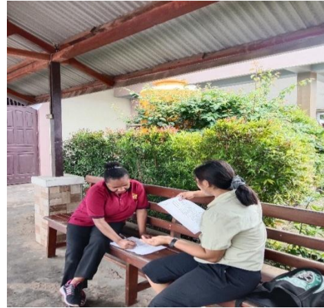
Gambar 2. Wawancara dengan Y.S.W 25 juli 2025, 11.09. Di lorong aula.