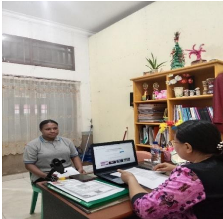
Gambar 11. Wawancara dengan R.M 24 juli 2025, 09.59. Ruang Waket III.