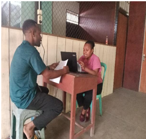
Gambar 3. Wawancara dengan A.B 2 agustus 2025, 12.09. Di kantin.