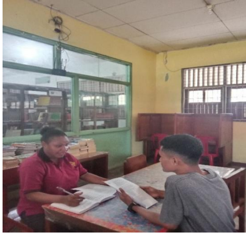
Gambar 1. Wawancara dengan T.V.R.M 25 juli 2025, 10.08. Di ruangan baca.