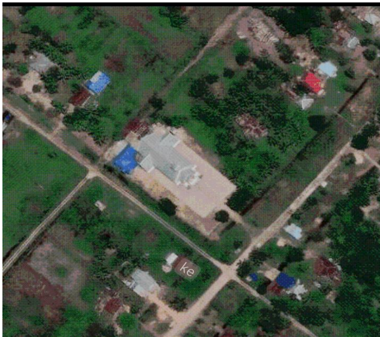
Gambar 4.1 Lokasi Gereja paroki sekaligus Gereja stasi Santo Petrus Erom

Kampung Bersehati (Erom) memiliki luas kurang lebih 910,75 Ha. Sebagaimana dikemukakan di atas kampung Bersehati terletak di Distrik Tanah Miring dan jarak dari kampung Bersehati (Erom) ke pusat Distrik berjarak 40 Km, sedangkan jarak dari kampung Bersehati (Erom) ke ibu kota Kabupaten sejauh 80 Km. kampung Bersehati dikategorikan sebagai kampung pinggiran kota, karena sebelumnya masih termasuk Distrik Merauke.