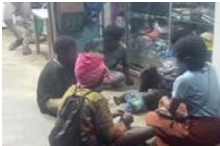
Anak- anak Aibon 23 Juli 2024