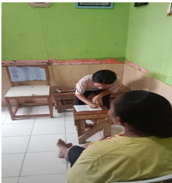
Ibu M. 20 Juli 2024