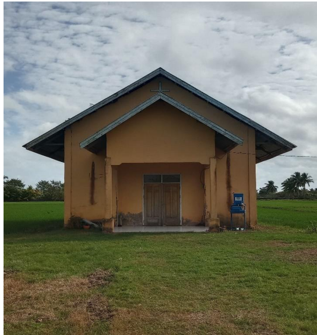
Ketua stasi Santo Agustinus SP 6