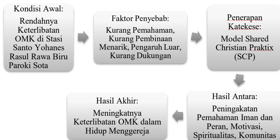
Gambar 2.1. Kerangka Pikir

kebutuhan akan katekese kontekstual dan partisipasi Dalam konteks pastoral, di butuhkan model katekese yang tidak hanya menyampaikan doktrin secara satu arah, tetapi juga menyentuh pengalaman hidup umat dan mengajak mereka untuk keterlibatan secara aktif. Katekese yang partisipasi aktif dan refleksi dapat membuka ruang dialog antara iman dan kehidupan sehari-hari , sehingga umat khususnya kaum muda merasa bahwa gereja relevan dengan pergulatan hidup mereka dalam konteks ini juga kaum muda memiliki cerita yang berbeda, cerita rakyat, cerita lisan, dan pengalaman hidup, dan mendorong semua kaum muda untuk ikut partisipasi aktif di lingkungan dan di tengah umat. Dengan demikian di dukung dengan gambar di